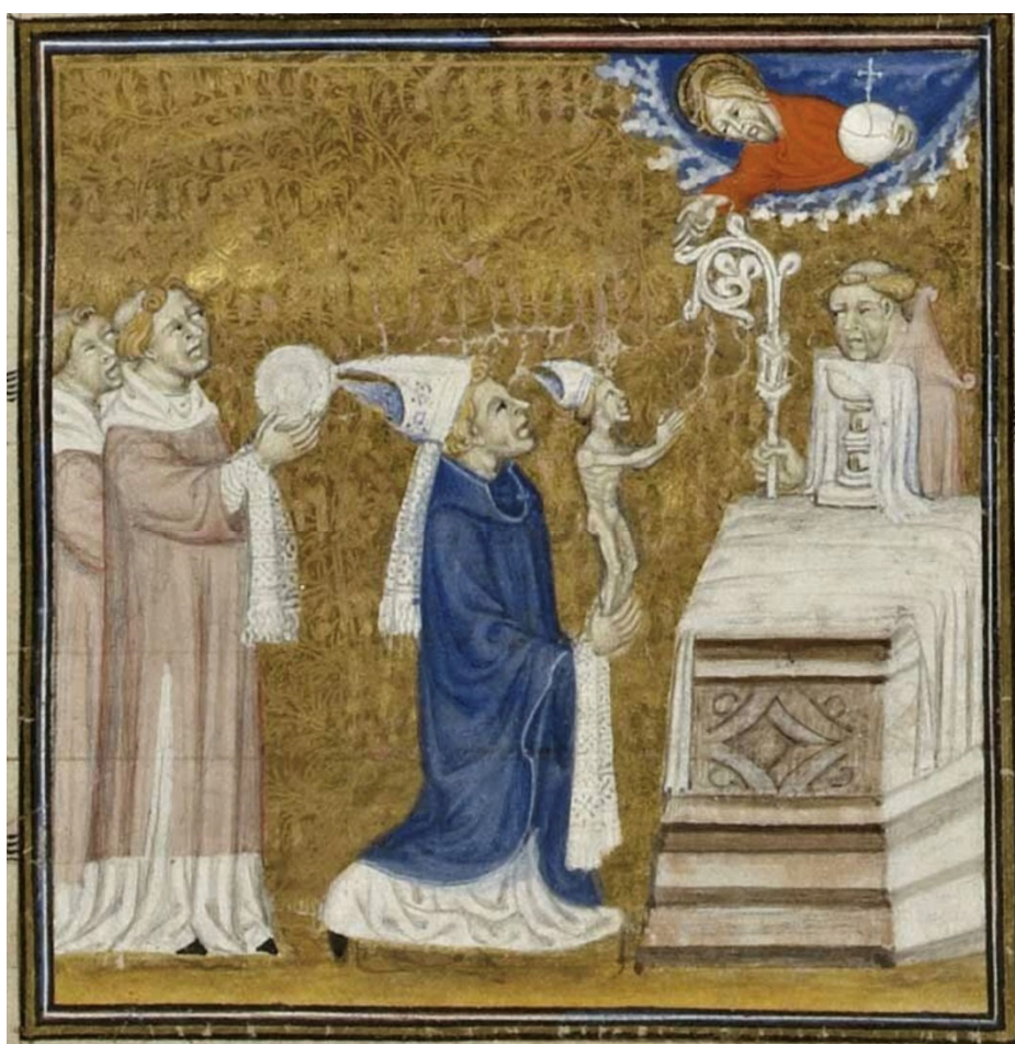
Figura 7. Pontifical , s. XIV, Biblioteca Municipal de Bayeux, ms. 61, f. 15v.

Aunque la mayoría de las composiciones se encuentran en misales, es decir, libros destinados al altar, también encontramos este tema iconográfico en otros tipos de manuscritos específicos de ciertos clérigos, como los manuscritos pontificios. En este caso, la disposición de los elementos es ligeramente diferente, ya que es necesario dotar a la imagen de la identificación correspondiente al orden episcopal del clérigo, incorporando las insignias pontificias en la elevación del alma. Un buen ejemplo es la imagen conservada en un pontifical de la biblioteca municipal de Bayeux, que data de finales del siglo XIV 6 , y que muestra a un obispo elevando su alma hacia Dios. El homúnculo de esta imagen aparece con mitra, al igual que el obispo, ya que la consagración episcopal imprime un carácter en el alma del hombre. La mesa del altar queda aquí relegada por la composición, colocada a modo de sarcófago y cubierta con un mantel. También llama la atención uno de los clérigos asistentes, que sostiene el báculo mientras se desarrolla la escena principal.