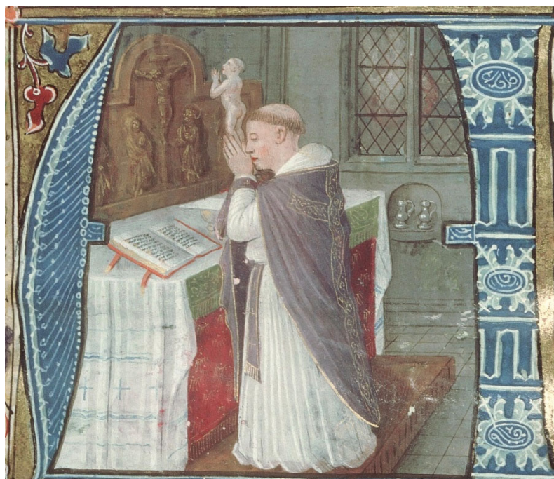
Figura 4. Misal utilizado en Tours, s. XV, Biblioteca Municipal de Tours, ms. 190, f. 7r.

La imagen es siempre la misma: un clérigo celebra la Eucaristía ante el altar y de sus manos juntas se proyecta una figura de su alma representada como un homúnculo, es decir, la figura de un niño pequeño desnudo, símbolo de pureza. El homúnculo se levanta y busca a Dios con la mirada cuando este está presente en la imagen. Por eso, el alma representada muestra una expresión piadosa similar a la del clérigo, que dirige al Señor una oración de confianza. Uno de los motivos más bellos de este tema visual se encuentra en un misal de Tours, conservado hoy en día en la biblioteca municipal. 3 El clérigo tonsurado, vestido con la casulla violeta del Adviento, junta las manos y cierra los ojos en señal de oración antes del comienzo de la misa. Su alma se eleva desde sus manos en actitud de exaltación, tal y como evoca el canto del introito. Delante del clérigo se encuentra el altar hacia el que se eleva su alma: una mesa probablemente de madera, decorada con dos capas de telas interiores, una roja y otra verde, sobre las que se superpone un mantel blanco. Sobre este mantel se pueden ver el corporal y parte de un cáliz. El retablo de madera, con su motivo central de la Crucifixión, es uno de los temas típicos que adornaban los altares en el siglo XV. Al fondo, la misma escena revela una hornacina en la pared, a modo de credencia, sobre la que descansan unas vinagreras.