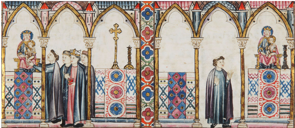
Figura 1. Cantigas de Santa María (Códice Rico) , Biblioteca del Real Monasterio del Escorial, ms. RBME T-I-1, f. 82r.

En el resto de las ilustraciones, las figuras del altar de la Virgen presentan siempre un rasgo distintivo: mientras que todos los elementos de la imagen están dispuestos en perspectiva lateral, la escultura de la Virgen María sentada —situada sobre el altar— se presenta siempre en perspectiva frontal, para que el lector del manuscrito pueda ver adecuadamente la imagen mariana como un elemento relevante del programa iconográfico. Así, no solo la escultura, sino también el propio altar, que sostiene la imagen de la Virgen, aparecen en posición frontal, casi siempre desplazados hacia uno de los lados de la viñeta para proporcionar espacio suficiente para representar a los fieles arrodillados implorando la intercesión mariana que caracteriza estas composiciones.