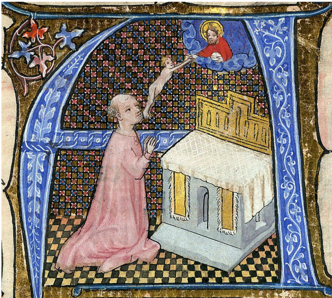
Figura 6. Misal utilizado en Saint-Amand de Tournai , s. XV, Biblioteca Municipal de Valenciennes, ms. 118, f. 9r.

Aquí, el clérigo se transforma en un orante que, al igual que el fiel que reza el salmo 24, dirige su alma hacia Dios, quien desde el cielo la recibe, no en una lectura fúnebre, sino en una lectura plenamente espiritual. No se trata de un viaje del alma, de un movimiento de la tierra hacia el cielo, sino más bien de una peregrinación espiritual mediante la cual el alma se dirige hacia Dios, tal y como se dirige la oración o tal y como se organiza el sentido del orden y la direccionalidad del culto. El altar de esta imagen es un bloque de piedra con nichos, siendo el central probablemente un acceso a la piedra del altar en la que se conservan las reliquias. La tela del mantel cubre toda la superficie superior y deja ver un pequeño borde en la parte delantera, cubriendo casi por completo los lados. El retablo tiene forma de frontón con un friso en forma de T invertida, sin otro motivo figurativo que su color dorado.