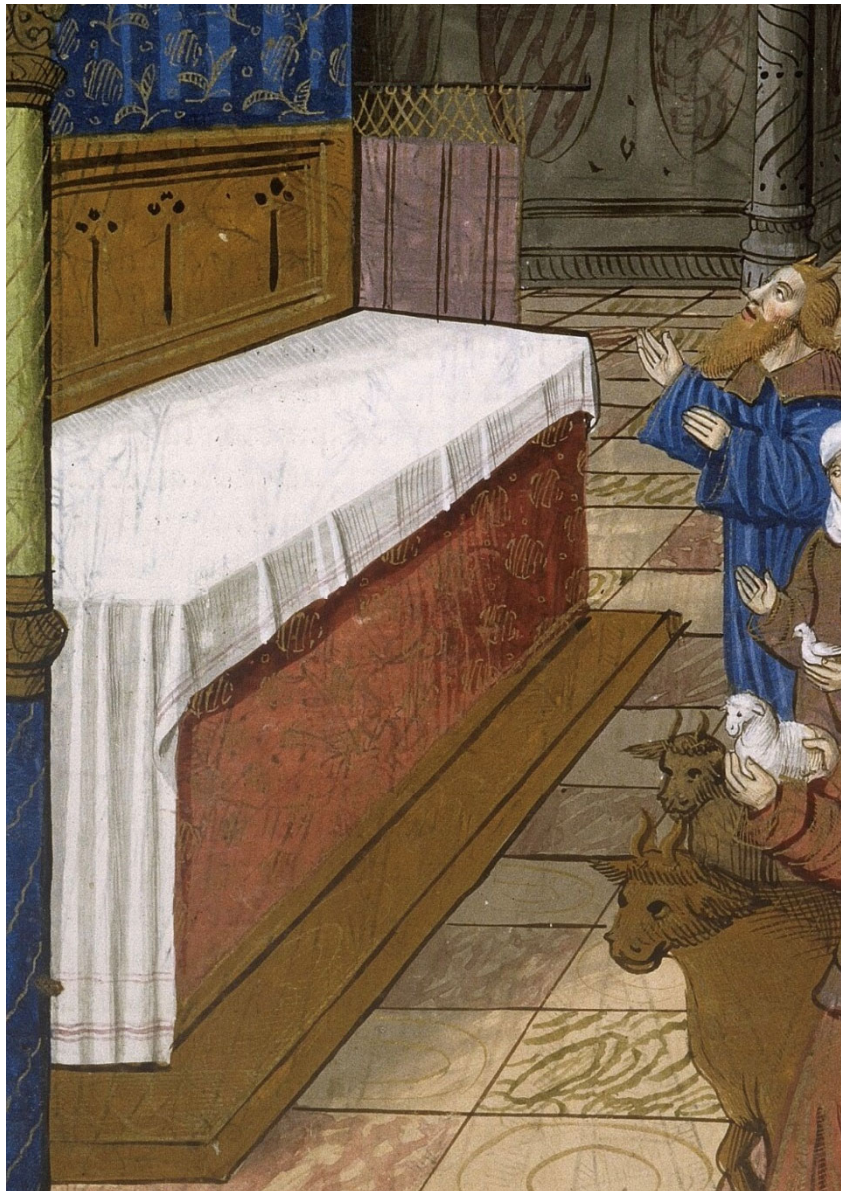
Figura 17. Biblia historiada , siglo XV, Biblioteca Municipal de Lyon, ms. Inc. 57, f. 87r.

de un templo cristiano. Una Biblia ilustrada conservada en la Biblioteca Municipal de Lyon 21 muestra a Dios dirigiéndose a Moisés, quien se dirige con animales para presentar un sacrificio en el altar. Sin embargo, el altar que vemos no es un altar monumental de piedra como el del templo del Antiguo Testamento, sino que sigue el formato que hemos visto en los misales franceses mencionados anteriormente. En este ejemplo, los drapeados son de un color violáceo apagado y están sujetos al soporte mediante un cordón dorado trenzado, lo que da testimonio de la diversidad de técnicas utilizadas para desarrollar este tipo de decoración.