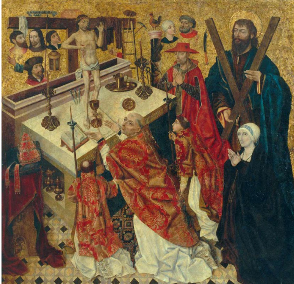
Figura 11. Diego de la Cruz, Misa de San Gregorio , h. 1480. Museo Nacional de Arte de Cataluña , Barcelona.

Las representaciones iconográficas de la misa de San Gregorio constituyen un auténtico placer visual a la hora de identificar los objetos que se colocaban en torno al altar durante la celebración de la Eucaristía. La necesidad de los pintores de mostrar el mayor número posible de detalles convierte estas imágenes en un tesoro inestimable para conocer la función morfológica de los altares, que servían para albergar espacios de almacenamiento adicionales, como las credencias y los nichos, así como para ser adornados con numerosas capas de elementos textiles, ricamente combinados entre sí y con los tejidos que están en contacto directo con las especies eucarísticas, como los corporales y los purificadores. Por otra parte, la riqueza de las vestimentas litúrgicas nos muestra una codificación casi completa de las vestimentas litúrgicas que se utilizaron a lo largo de la época moderna y hasta el siglo XX para el servicio de la liturgia cristiana. Estas vestimentas, adornadas con bordados, apliques y tejidos únicos, demuestran que no se escatimaron medios para dotar a las sacristías de las catedrales más destacadas y de los centros de culto más importantes con vestimentas de gran valor, aunque muy pocas de ellas hayan sobrevivido hasta nuestros días.