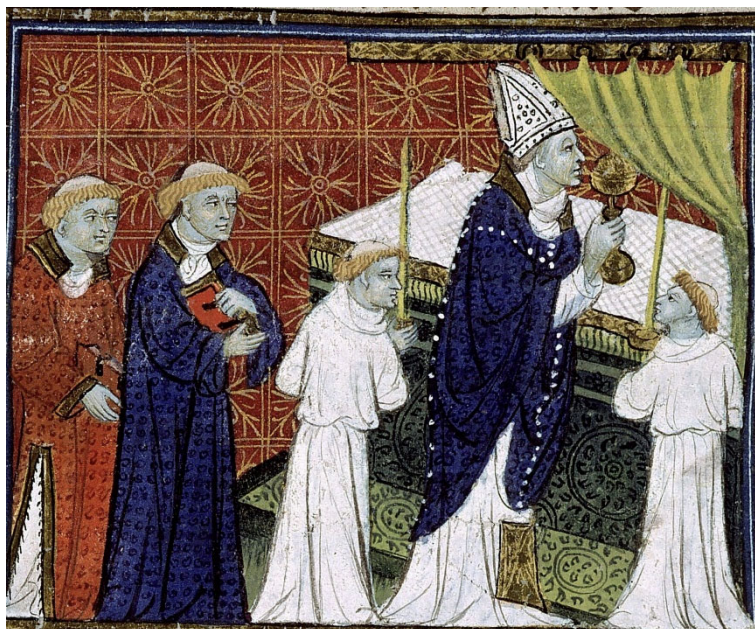
Figura 12. Peregrinación de la vida humana , siglo XIV, Biblioteca Sainte-Geneviève de París, ms. 1130, f. 8v.

Los cortinajes litúrgicos ( cortinis, pannum, velum, tetravela ) son un primer elemento digno de atención que permite ocultar la visibilidad de las especies eucarísticas y, por lo tanto, ocultar una parte de la misa a los fieles. Un manuscrito de finales del siglo XIV de La peregrinación de la vida humana , de Guillaume de Digulleville, revela una curiosa imagen de Moisés celebrando la Eucaristía, oculto tras un cortinaje litúrgico. 15 El iluminador separa el telón verdoso sujetándolo artificialmente por el lado derecho, como para evocar indiscretamente una ventana oculta que nos permite ver la acción ritual que se desarrolla detrás, que no es otra cosa que la doxología con la píxide levantada.