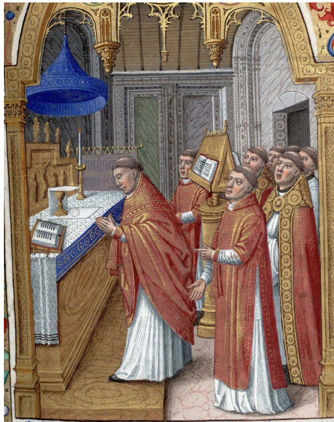
Figura 14. Misal , siglo XV, Biblioteca Mazarine de París, ms. 410, f. 152r.

Las representaciones iconográficas muestran muy claramente la presencia de cortinas ya desde el siglo XIV. Aunque este uso pueda tener influencias orientales, la disposición de los altares orientales —bajo baldaquines cuadrangulares— no explicaría la incorporación de rieles para desplazar estos velos, destinados muy probablemente a ocultar la latens deitas . Existe un primer grupo de imágenes en las que se observa una parte específica del canon de la misa y, por consiguiente, las cortinas aparecen velando esos momentos. Se trata de las imágenes utilizadas para ilustrar ciertos misales franceses, como el conservado en la biblioteca del cardenal Mazarin en París 17 . Un clérigo se inclina ante las ofrendas, con las manos juntas, asistido por dos diáconos. El altar se representa aquí como un gran mueble de madera, cubierto por al menos dos manteles: uno inferior, del que sobresale un borde azul a juego con el baldaquín suspendido, y otro blanco con adornos de encaje, sobre el que se distinguen claramente el corporal, el cáliz, el purificador y la pala. A uno de los lados del altar (el más alejado del espectador), sobresale un soporte fijado al retablo. De este soporte cuelgan cortinas de un violeta apagado, sujetas al soporte mediante un cordón dorado.