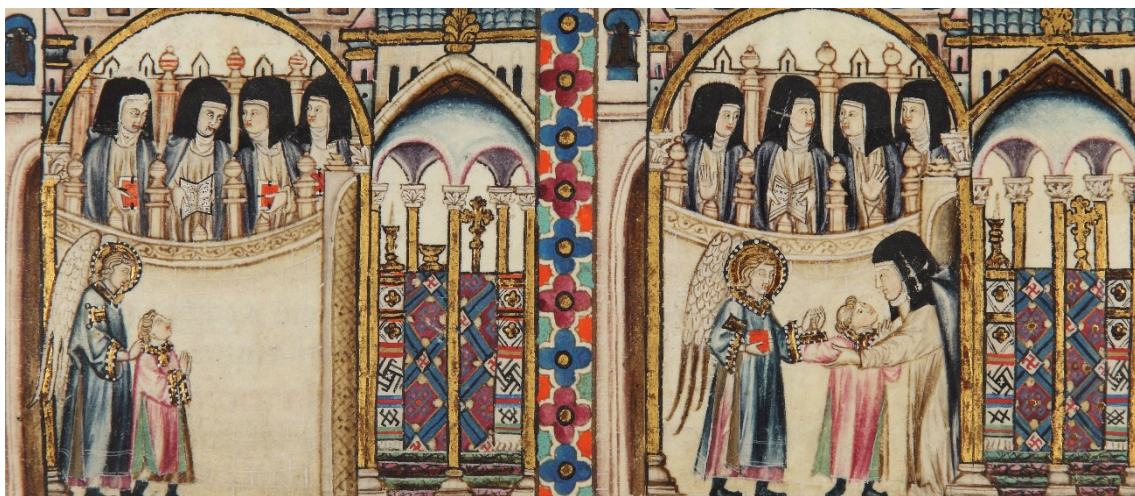
Figura 2. Cantigas de Santa María (Códice Rico), Biblioteca del Real Monasterio del Escorial, ms. RBME T-I-1, f. 82r.

La Cantiga 55 narra la historia de una monja que queda embarazada de un abad y que, antes de dar a luz, arrepentida de su pecado, implora la intercesión de la Virgen. En las ilustraciones de este poema, destaca el altar del monasterio femenino al que pertenece la religiosa: cubierto por un opulento baldaquín, se aleja de los modelos formales presentes en las demás iluminaciones del manuscrito. Ningún elemento de la composición textual respalda esta nueva representación, por lo que debe considerarse como un simple desarrollo iconográfico que completa la variedad de espacios arquitectónicos representados en las cantigas y que también se encuentra en otras imágenes del manuscrito.