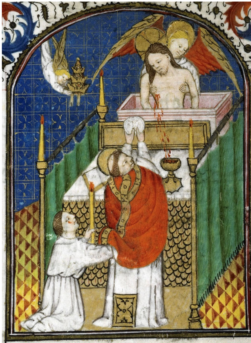
Figura 13. Libro de horas, siglo XV, Biblioteca Municipal de Lyon, ms. 5142, f. 157r.