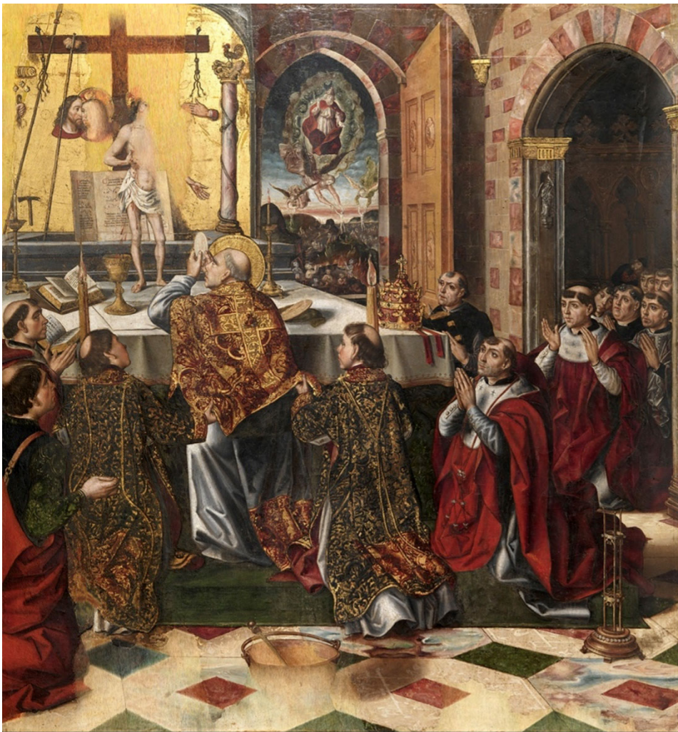
Figura 10. Pedro Berruguete. Misa de San Gregorio , finales del siglo XV. Museo de Burgos.

Otro panel que representa la misa de San Gregorio se encuentra hoy en el Museo de Burgos y procede probablemente de la iglesia de Cogollos. Obra del pintor italo-flamenco Pedro Berruguete en su última etapa castellana, divide la composición en tres espacios presentados de forma muy original. En primer plano, los clérigos se reúnen en torno al altar, tanto los diáconos presentes como los cardenales y los funcionarios de la Curia romana. Al fondo se representa el milagro que tuvo lugar sobre el altar, en el que se ve a Cristo presente corporalmente de pie ante el canon del altar abierto, apoyado en la cruz. El tercer plano lo forman las almas del purgatorio salvadas por Dios, bajo la representación iconográfica intemporal del Padre eterno, a quien se ve a través de un portal abierto, pues es mediante el sacramento de la Eucaristía como los cristianos pueden ser salvados y acceder a la vida eterna.