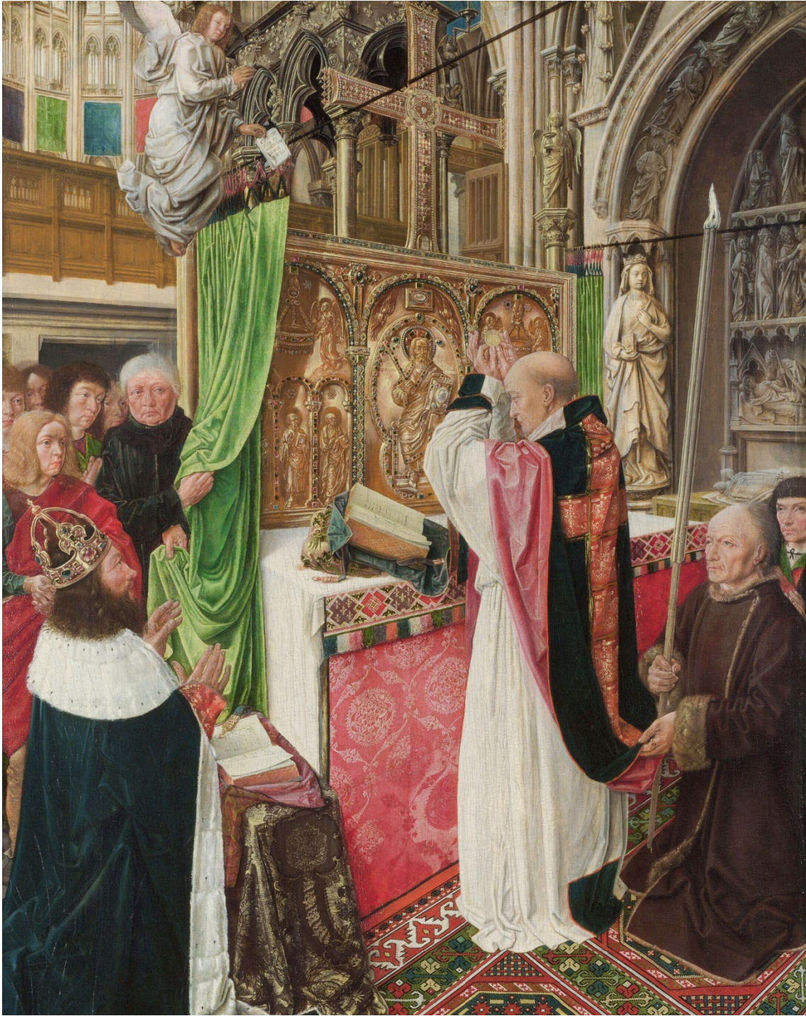
Figura 8. La misa de San Gil , h. 1500. National Gallery, Londres .

Más allá del acontecimiento milagroso y de su fundamento como una de las escenas de la vida del santo, la imagen reviste un gran interés desde el punto de vista de la representación de los altares a finales de la Edad Media. El altar de la misa de San Gil es un mueble fijo, revestido con un antependio de tela y cubierto por un borde textil decorativo, sobre el que se coloca el mantel. Al altar va fijado un retablo con un frontal de altar, con incrustaciones de piedras preciosas. Por encima de este retablo, una cruz,