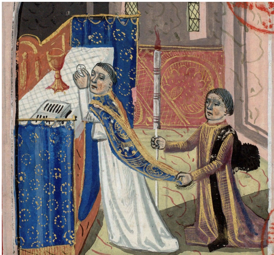
Figura 15. Decretales de Gregorio VIII , XV e , Biblioteca Mazarine de París, ms. 208, f. 158r.

Otro manuscrito de la misma biblioteca contiene las Decretales del papa Gregorio VIII y presenta una ilustración de la consagración del pan en la que un joven asistente levanta la casulla del celebrante para facilitar la genuflexión, mientras sostiene una vela encendida. 18 Ya hemos mencionado este gesto en una publicación anterior 19 , aunque en este caso la escena reviste gran importancia, ya que el paño del altar es del mismo color que el de la casulla del celebrante. La perspectiva permite ver no solo las cortinas de la derecha, como en el misal mencionado anteriormente, sino también las de la izquierda, completamente corridas y fijadas al soporte mediante ganchos.