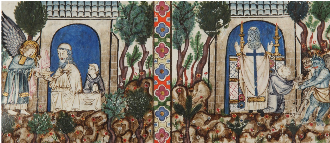
Figura 3. Cantigas de Santa María (Códice Rico), Biblioteca del Real Monasterio del Escorial, ms. RBME T-I-1, f. 165r.

Por su parte, en la Cantiga 115, un niño que ha partido en busca de la salvación para evitar caer en las garras del demonio es enviado a casa de un ermitaño que vive en el aislamiento. Tras implorar la intercesión divina y rezar las horas, el ermitaño celebra la eucaristía mientras los demonios se llevan al niño. Para mostrar estos dos acontecimientos en la misma escena, el iluminador representa al clérigo celebrando la eucaristía, por primera vez, de espaldas a la composición, de modo que se ve a los demonios llevándose al joven.