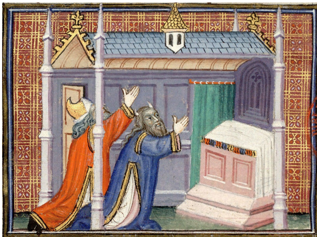
Figura 18. Graciano, Decreto , siglo XIV, Biblioteca Mazarine de París, ms. 1290, f. 35v.

El mismo tema del Antiguo Testamento aparece en un manuscrito del Decreto de Graciano, que data esta vez del siglo XIV y se conserva en la Biblioteca Mazarine de París. 22 En este caso, la imagen muestra el marco arquitectónico completo del templo, evocado en analogía formal con una iglesia cristiana. Moisés y Aarón aparecen representados de rodillas, con las manos extendidas, implorando a Dios, quien, en este caso, no se manifiesta visiblemente. El altar se representa preparado para la Eucaristía, con una estructura de piedra sobre dos escalones que lo elevan. Está cubierto por un paño cuyas decoraciones de colores son visibles desde el frente y por un mantel de lino blanco que cuelga por los lados. Las cortinas solo son visibles en el lado izquierdo del altar, ya que la perspectiva lateral impide ver el lado derecho. En este caso, la tela del velo es de un verde apagado, sujeta al soporte por anillas de color claro.