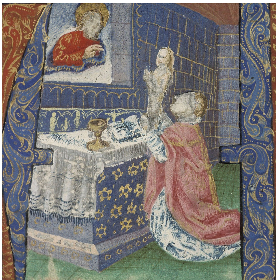
Figura 5. Misal utilizado en Lyon , s. XV, Biblioteca Municipal de Lyon, ms. 515, f. 11r.

La misma escena aparece representada en un misal de Lyon, aunque con una disposición diferente. 4 Aquí, el altar está empotrado en una pared en la que hay una abertura a través de la cual aparece Dios Padre, en lugar del retablo. La mesa del altar presenta una pequeña predela, a modo de franja decorativa, salpicada de motivos iconográficos hagiográficos, que se combinan con las decoraciones de la fachada, aplicadas directamente sobre la piedra. En el centro del altar se encuentra el misal abierto y a la izquierda el cáliz, colocado en una disposición extraña para la celebración del rito: era habitual que los iluminadores no reflejaran fielmente este tipo de detalles, tratando de captar una síntesis conceptual clara del tema que se mostraba.