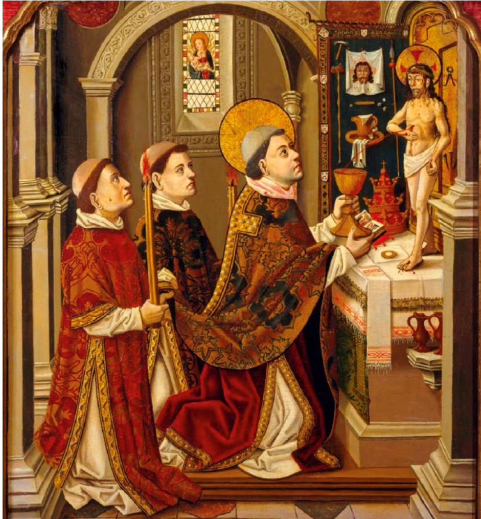
Figura 9. Misa de San Gregorio, h. 1485-1495. Museo Metropolitano de Arte, Nueva York.

La mesa del altar es un elemento importante de esta imagen. Aunque su base es de piedra, con decoraciones en los zócalos, el altar está cubierto por un mantel de tela y unos ribetes, también de tela, que lo rodean a modo de bordes. Por encima, un paño de lino blanco hace las veces de sudario, recogiendo las gotas de sangre que caen de las heridas de los pies de Cristo. Sobre el altar se puede ver no solo el cáliz, sino también un corporal con una sencilla patena y una hostia, que se supone ya consagrada, así como un purificador cuyo bordado rojo combina con la decoración del mantel. En el lado izquierdo, presentado en la perspectiva de la imagen como en un plano más alejado, se puede ver el misal, abierto en la página del Te igitur —la ilustración de la Crucifixión lo atestigua— y la tiara papal, que nos indica quién es la persona que preside la Eucaristía. En el lado derecho, un pequeño pedestal sostiene algunas vinagreras de metal. Sobre el altar, un retablo sirve de panel de fondo y, al fondo, el telón litúrgico abierto muestra los instrumentos de la Pasión mencionados anteriormente. La intercesión de la Virgen María